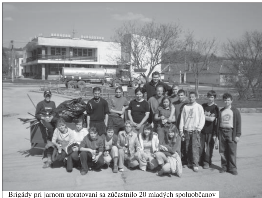
Brigády pri jarnom upratovaní sa zúčastnilo 20 mladých spoluobčanov

Vody nemáme vôbec tak veľa, ako si myslíme. Sú dediny, kde pijú obyvatelia vodu zo studní, ktoré sú čoraz špinavšie. V potokoch si namiesto lodičiek púšťajú niektorí ľudia škodlivé veci a je to dokonca aj vidno, dokonca aj sused o susedovi vie, že vypúšťa do potoka odpad, ale je mu to jedno. Nerozhnevá si predsa suseda?! Ale nemalo by nás to mrziť voči našim deťom? Veď nemať čistú vodu, pekné okolie, zdravú prírodu je veľká