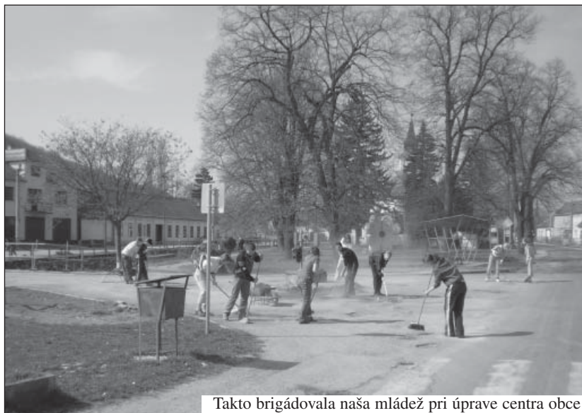
Takto brigádovala naša mládež pri úprave centra obce