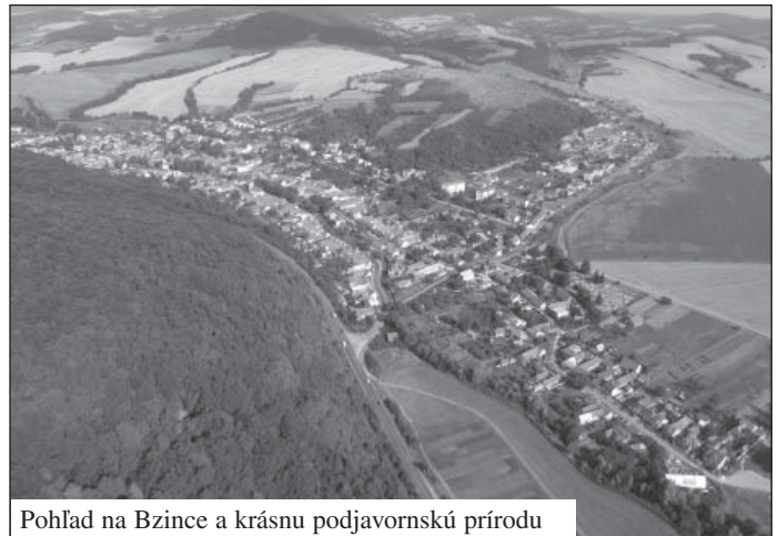
Pohľad na Bzince a krásnu podjavorinskú prírodu