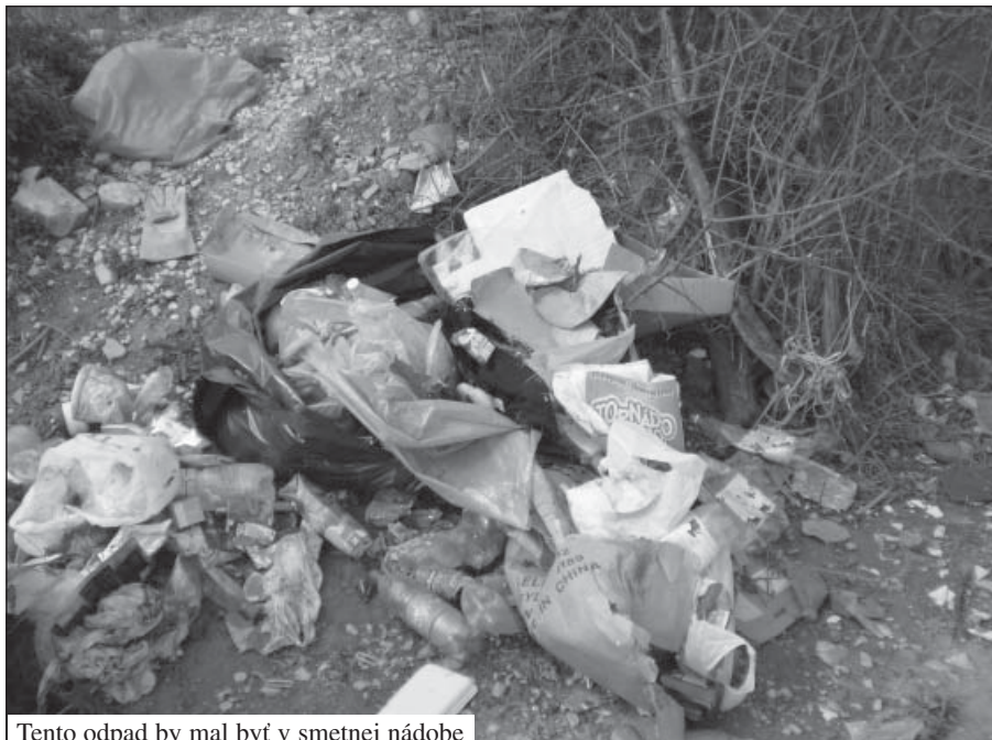
Tento odpad by mal byť v smetnej nádobe

V tomto čísle Bzinského chýrnika je zverejnený návrh na zmenu Všeobecného záväzného nariadenia (VZN) obce o komunálnom odpade. Je potrebné zmeniť systém zberu komunálneho odpadu v našej obci? Podľa mojich vedomostí k uvedenej problematike k tejto zmene malo