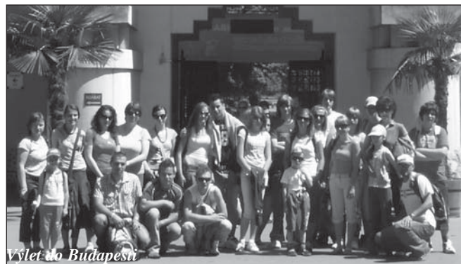
Výlet do Budapešti