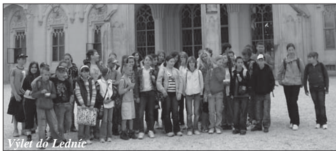
Výlet do Lednic