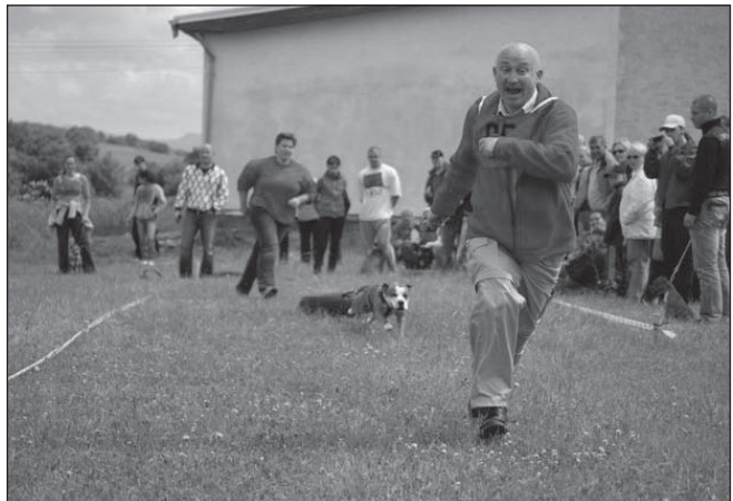
V zápale boja