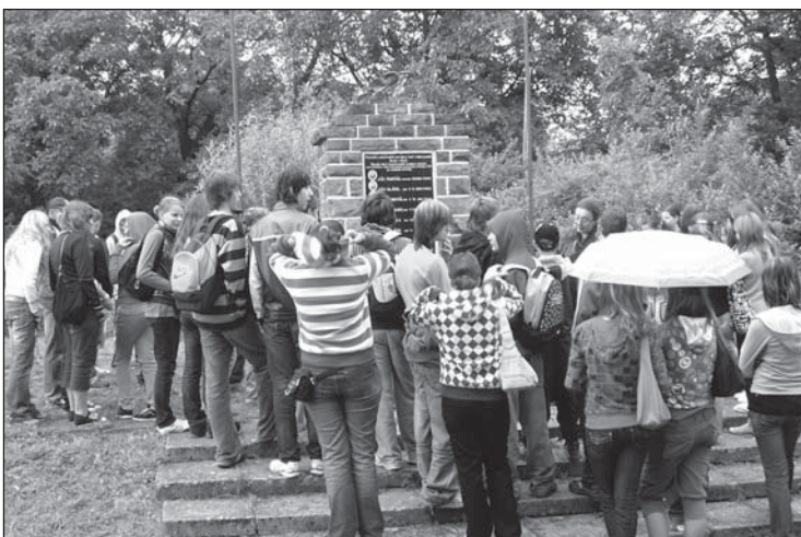
Exkurzia po stopách SNP - Pri pamätníku v Cetune