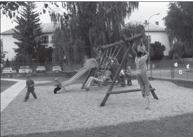
Deti sa tešia z nového ihriska

Myšlienka výstavby verejného detského ihriska v Bzinciach pod Javorinou vznikla asi pred rokom. Keď sme sa na prechádzkach s deťmi stretávali s ostatnými mamičkami, často sme hľadali vhodné miesto, kde by sa naše deti mohli zabaviť. Oslovili sme s touto