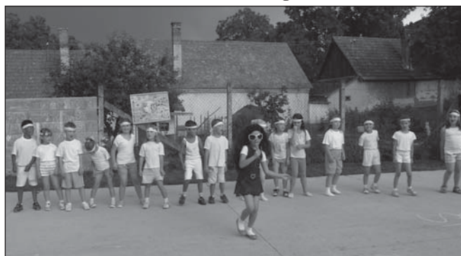
Po otvorení ihriska nasledovala školská slávnosť, ktorú však predčasne ukončil lejak. Svoje vystúpenie stihli len prváci.