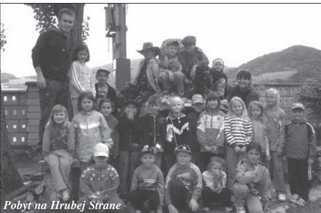
Pobyt na Hrubej Strane

Koniec školského roka majú žiaci najradšej. Nielen preto, že sú už blízko prázdniny, ale aj preto, že je to čas, kedy sa už neučí a chodí sa na výlety. V tomto roku ich žiaci absolvovali viacero a boli rozmanité.