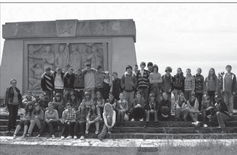
Exkurzia po stopách SNP - Pri pamätníku na vrchu Roh