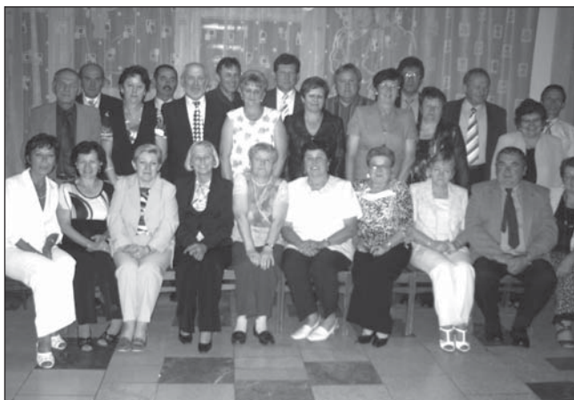
Stretnutie po 40 rokoch